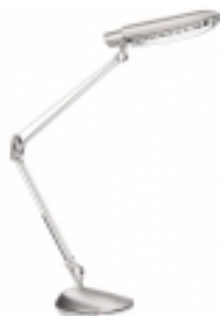
Слика: приближан изглед