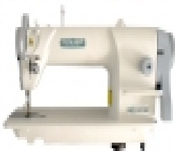
Слика: приближан изглед