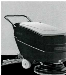
Слика: приближан изглед