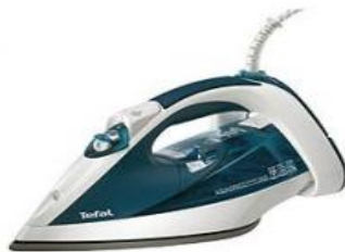
Слика: приближан изглед