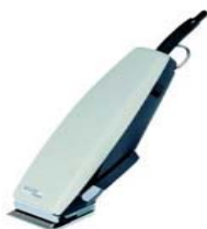
Слика: приближан изглед