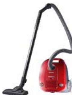
Слика: приближан изглед