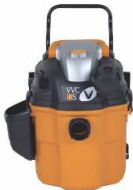
Слика: приближан изглед