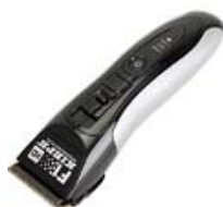
Слика: приближан изглед