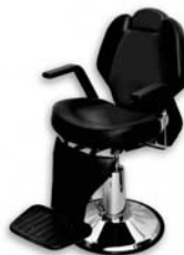
Слика: приближан изглед