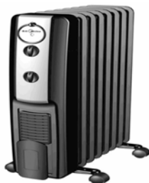
Слика: приближан изглед