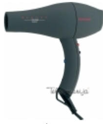
Слика: приближан изглед