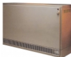
Слика: приближан изглед