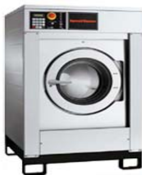
Слика: приближан изглед