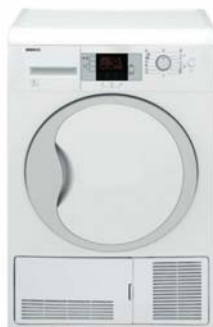
Слика: приближан изглед