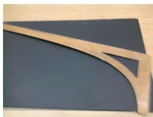
Слика: приближан изглед